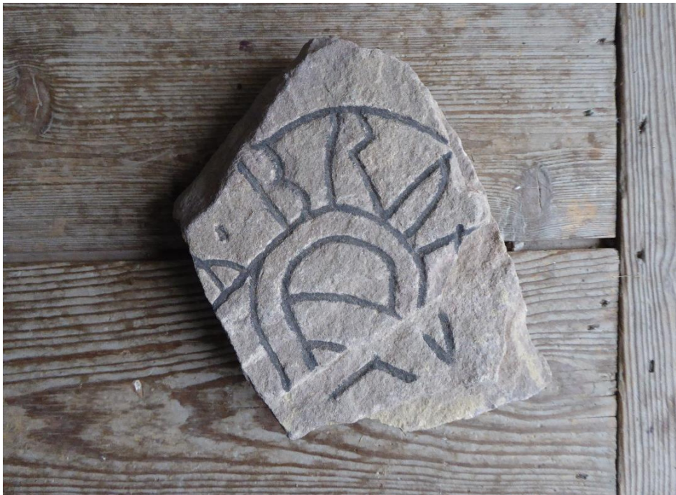
Fig. 3. U Fv1979;243A Husby-Sjuhundra kyrka.